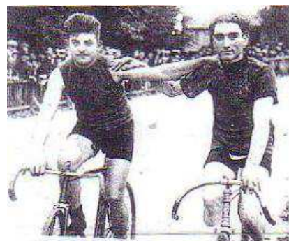
Photo ci-dessus, réalisée à Limoges et confiée par Edouard BOUDAUD à Claude LACAN.

Sportif complet, Edouard pratique également l'haltérophilie et la gymnastique. Pour le plaisir, il lui arrive de disputer des combats de boxe.